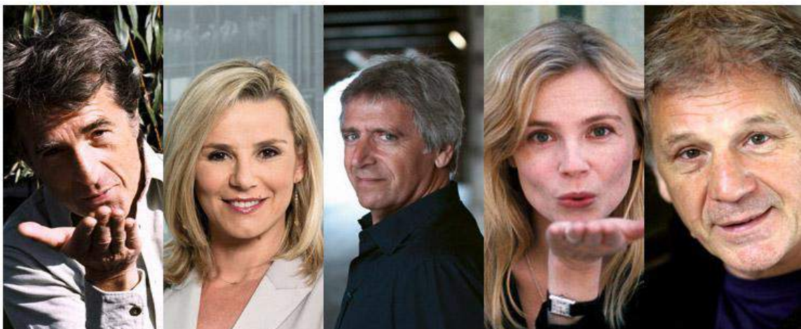
François Cluzet, Laurence Ferrari, Yves Duteil, Isabelle Carré, Gérard Lenorman